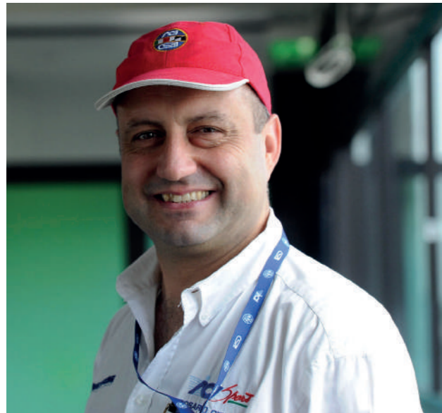
Ricca e varia la 107 ^ Targa Florio

L'edizione 2023 della corsa automobilistica più antica del mondo si arricchisce. La gara organizzata dall'AC Palermo con il supporto diretto dell'Automobile Club d'Italia si fa in cinque e attraverso la collaborazione della Delegazione ACI Sport Sicilia allarga le possibilità e le ambizioni di tanti validi equipaggi locali. Terzo round stagionale del Campionato Italiano Assoluto Rally Sparco e del Campionato Italiano Rally Auto Storiche, aprirà il Campionato Italiano Rally Junior e sarà prova della Coppa Rally di 8 ^ Zona. La grande novità è la Targa Florio Historic Regularity Rally, la gara con validità tricolore di Regolarità a Media, specialità appassionante e sempre più emergente nel panorama automobilistico nazionale riservato alle auto storiche, che condivide con il Rally la sede di partenza ed arrivo e poi ha un percorso completamente dedicato.